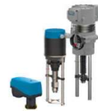
Servomotoren voor regelarmaturen